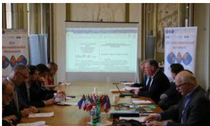
Espaces de réunion

Le World Trade Center Metz-Saarbrücken propose une offre premium au coeur de Metz pour séminaires, accueil clients/prospects, incentive commerciale, team building, networking... Salle de réunion et espace Club «business friendly» (FR / ENG / DE).