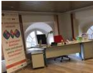
Espaces de bureau